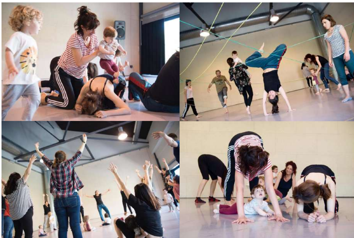
Taller intergeneracional amb famílies de les Escoles Bressol Municipals Niu d'Infants i Collserola al Graner (01/06/19)