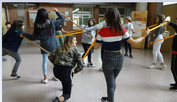
What's happening? IES Montjuïc, Artefactum.