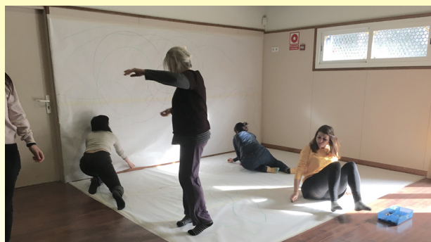
Formacions amb Claustres, Escola Ramon Casas, Artefactum.