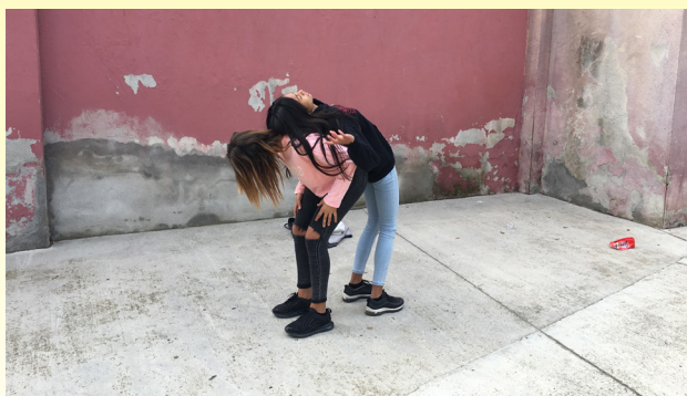
What's happening? IES Montjuïc, Artefactum