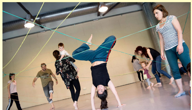
Junts a la jungla, Taller Familiar, Col·lectiu Big Bouncers