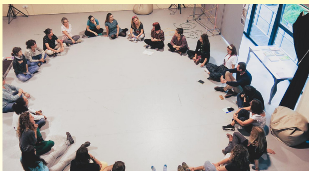
Trobades entre mestres i artistes. Graner, Artefactum.

No se li escapa a ningú que el cos i el contacte són dos dels principals damnificats del nou paradigma del "distanciamnt social". És evident que són dos dels eixos principals de Zones de Contacte , però també són dues dimensions fonamentals de qualsevol relació pedagògica i artística. Quan parlem de contacte, no ens referim exclusivament al contacte directe dels cossos sinó a la presència, el risc i l'oportunitat d'aventurar-nos amb l'altre cap allò que encara no sabem. Per més que visquem en societats hiperconnectades i disposem d'entorns d'educació virtual, l'experiència de l'aprenentatge necessita relacions intercorporals per la senzilla raó que el contacte no és connexió. És cos, presència, tacte, afecte, diàleg, trobada, energia i moviment. Una relació viva que demana el cultiu de la confiança, una altra de les grans qüestions que plantegen les pedagogies del contacte 2 . Fer redundar la confiança sobre la norma de la distància social pot ser una mesura necessària temporalment, però no pas el fonament d'un projecte educatiu, artístic o cultural.