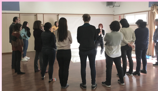
Formacions amb Claustres, Escola Ramon Casas, Artefactum.

Les que abracem una educació basada en els aprenentatges sabem que les normes condueixen, orienten, però no ensenyen res. El que ensenya és l'interès, el contacte i l'experimentació amb la matèria i amb l'altre. La norma només és un vehicle, una pauta que orienta conductes i, en el millor dels casos, permet els aprenentatges. El que emana de la norma no té res a veure amb l'aprenentatge si no som capaços de fer-ne experiència i obrir nous camps d'acció. I pot passar, com està passant, que la norma derivi en comportaments sociofòbics basats en la por irracional a l'altre i al món. Les mestres i les artistes ho sabem prou bé: la confiança, la intel·ligència i l'amor no rau en la norma, sinó en els cossos i les seves relacions. Si una norma no es basa en relacions de reconeixement i confiança, esdevé la cosa més buida del món. Aleshores, com podem conciliar les pràctiques pedagògiques i artístiques amb "la nova normativitat"? És possible? És això, l'escola? És això, l'escena? De quines experiències i històries podem servir-nos en un moment en què se'ns demana que continuem essent "escola" sense escola o "escena" sense cossos? Quins límits i potencialitats plantegen els entorns d'ensenyament virtual?