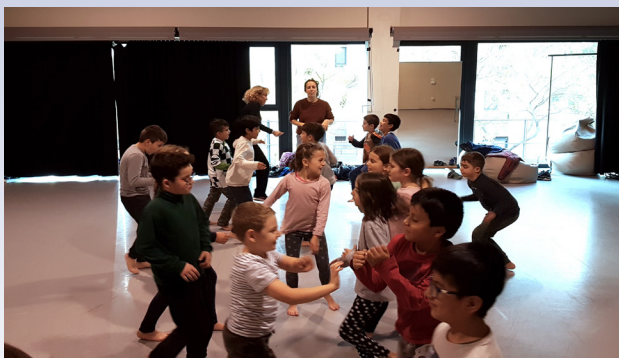
JAUla Libre, Graner, Iniciativa Sexual Femenina

Entenem els processos oberts com un espai d'obertura de possibilitats, al qual tothom hi està convidat a descobrir i a arriscar-se sense objectiu formal. Aquest moment de cerca exigeix una gran atenció general, per la qual cosa el considerem una activitat d'alta intensitat. Amb el desig de trencar amb aquest binarisme, proposem pensar processos oberts puntuats de productes. D'aquesta manera, volem facilitar pauses que permetin sortir durant una estona del dubte, agafar aire abans de tornar a submergir-se a l'aigua. Potser per bussejar a més profunditat, ja que a més de permetre que els i