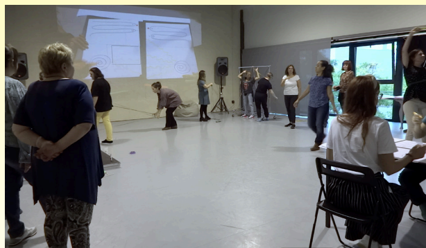
Trobades entre mestres i artistes, Graner, Artefactum