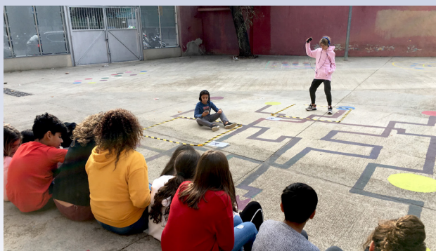
What's happening? IES Montjuïc, Artefactum.

Aquest centre utòpic de l'escola frega amb la condició heterotòpica del teatre, on el joc amb el nom (propi, aliè, prestat, imaginat, recordat, etc.) dona lloc a l'espai i el temps de les ficcions. De la mateixa manera que les escoles necessiten parets, les ficcions del teatre necessiten els seus marcs, a voltes invisibles, però tan inviolables com els murs reals. Parets, murs o potser barricades que contenen aquells instants que ens dona l'art, aquelles ficcions que se separen amb valentia de la vida per retornar-nos-la i alliberar-nos de les presons de la realitat. No parlem ni d'entreteniment ni d'alienació,