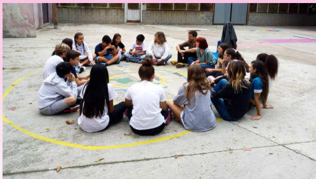
What's happening?, IES Montjuïc, Artefactum.