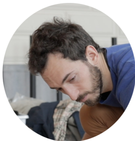
# antes collado

Artista del moviment, el cos i la imatge amb base a Barcelona. Nascut a Villamalea (Albacete, 1991) m'he format en dansa contemporània a València, danses urbanes i balls de saló esportius de manera autodidacta. Paral·lelament he estudiat a la Facultat de Belles Arts i a l'ESAD de València.