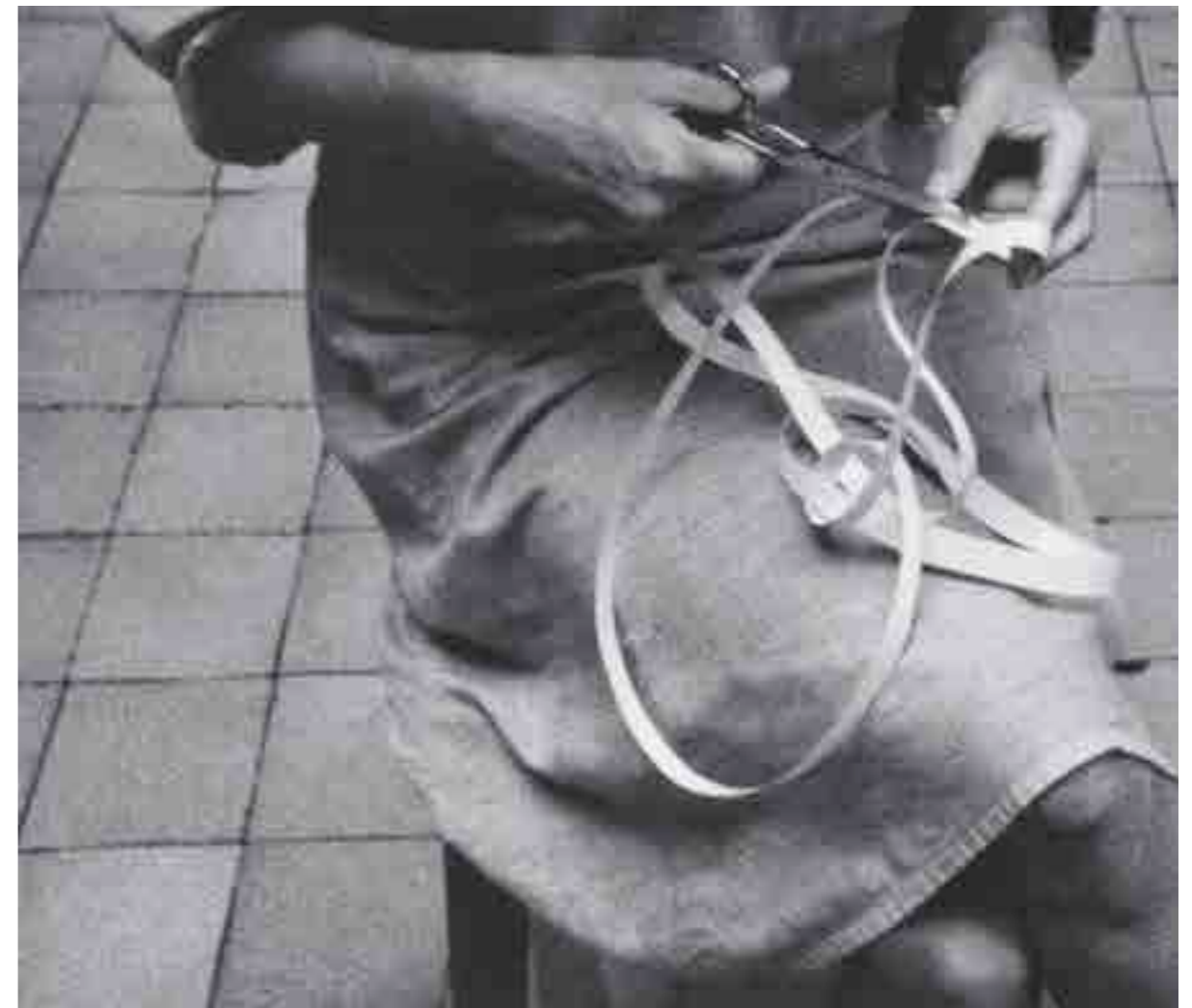
Lygia Clark. Caminhando , 1964.

Caminhando es una obra de la artista brasileña Lygia Clark que implica la participación del público. En su propuesta, Lygia ofrecía breves pautas para cortar una hoja de papel en blanco con una tijera, partiendo de la cinta de Möebius hasta alcanzar variaciones infinitas, siempre curvas. Según la artista: "Es el acto lo que produce Caminhando , nada existe antes y nada después" 2 .